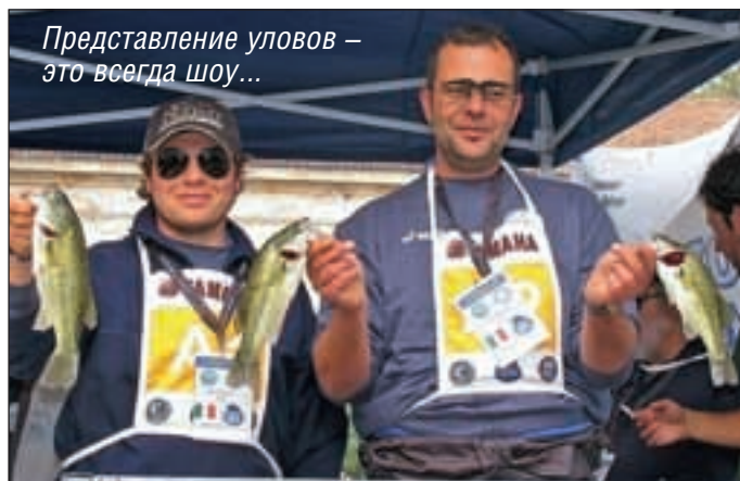
Представление уловов – это всегда шоу...