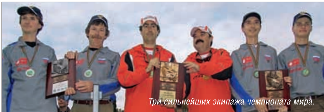
Три сильнейших экипажа чемпионата мира.