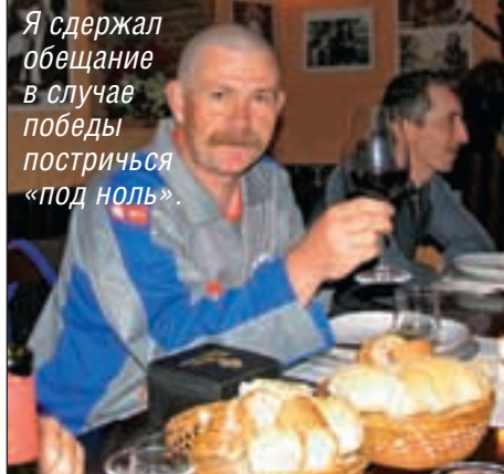
Я сдержал обещание в случае победы постричься «под ноль».

4. Dream Team. Достаточно часто бывало так, что в составе российских рыболовно-спортивных команд на зарубежные спо-