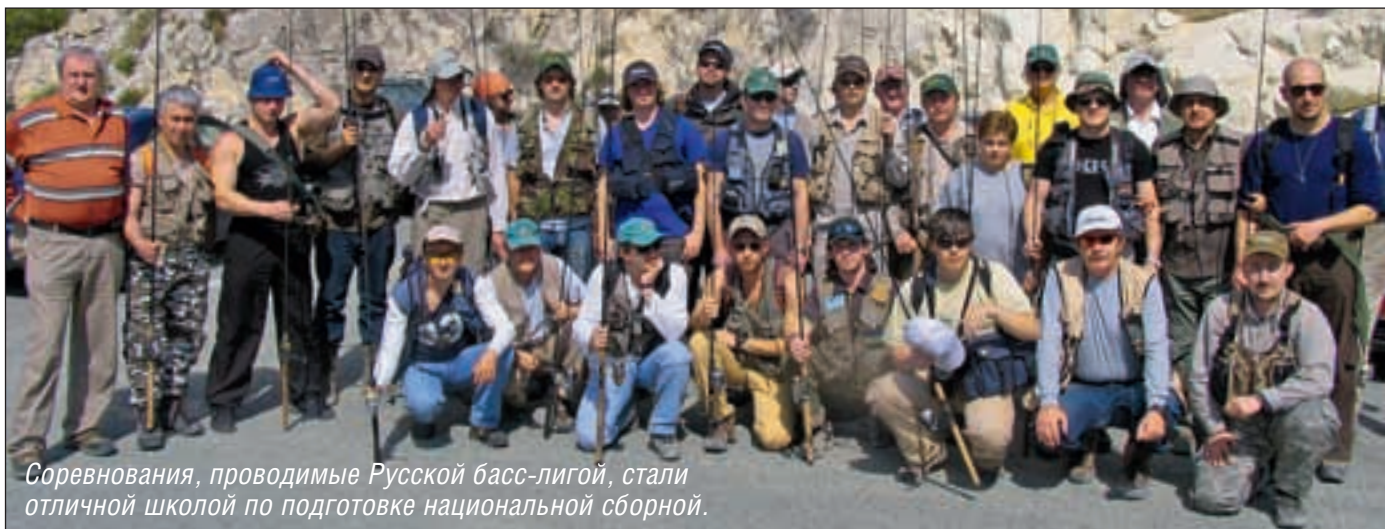
Соревнования, проводимые Русской басс-лигой, стали отличной школой по подготовке национальной сборной.

ло приятно уже потому, что в Европе о нас знают.