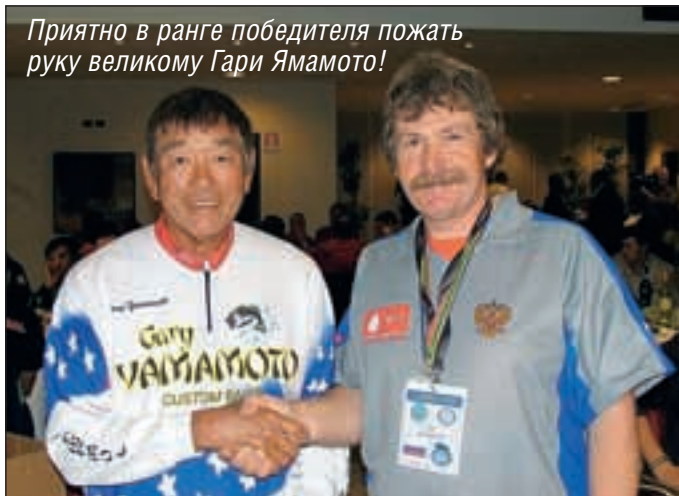
Приятно в ранге победителя пожать руку великому Гари Ямамото!

Во многих видах спорта команды, приезжающие на соревнования в роли аутсайдеров, должны решить для себя вопрос, что делать в плане общей стратегии: попытаться скопировать действия фаворитов или же противопоставить им свою игровую схему. Первое дает некоторую гарантию места ближе к середине турнирной таблицы, второе, в общем-то, авантюра – следуя по этому пути, гораздо больше вероятность с треском проиграть, но ведь есть шанс и выиграть. Понятно, что нас, особенно с учетом прежних результатов, никто из признанных претендентов на медали как конкурентов не воспринимал, что определенно было нам на руку. Так, итальянцы были только рады, когда в качестве судьи одного из их экипажей был привлечен запасной российской команды. И то, где, как и на что ловил этот экипаж, всем нам было известно с самого начала. Хозяева же считали, что пусть лучше об их секретах будет известно русским, чем американцам или португальцам. Но нам-то было все равно, ибо с