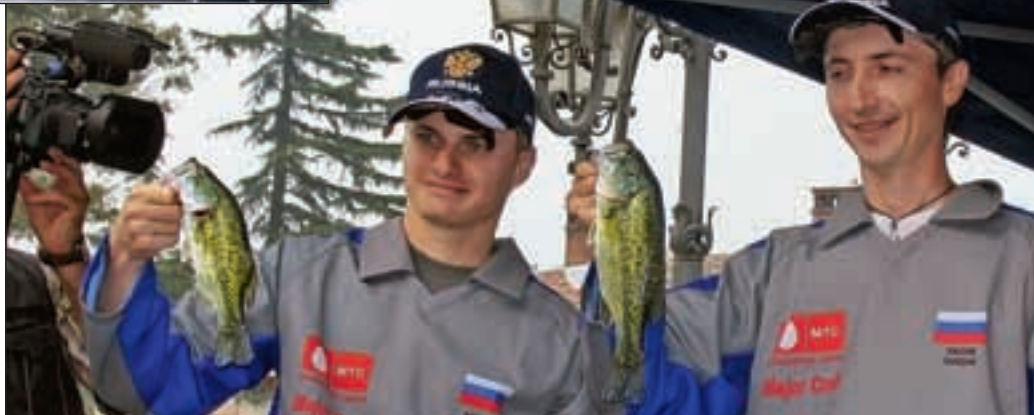
...и мы в нем – на главных ролях!

3. Живая мысль против шаблонности. Итальянский экипаж, который обслуживали наши судьи, как оказалось, все три дня работал как автомат – по одной программе: один и тот же маршрут и одни и те же приманки (у обоих). Казалось бы, ког-